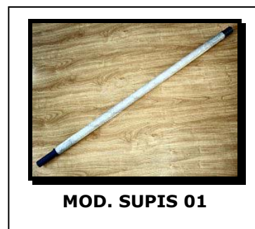
MOD. SUPIS 01

Isolation fiberglass pole suitable with all Protel antennas type ARL and ARY. Absolutely necessary for vertical polarization measurements, it allows to avoid metallic pole interference. Strong to mechanical stress, \varnothing 29.9 mm. Length 1000 mm. Weight 900 g.