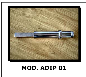
MOD. ADIP 01

Adattatore meccanico che permette di utilizzare le antenne serie AR0213 su pali aventi un attacco quadrato. L'innesto misura 15.98 x 15.98, è costruito in ottone nichelato e pesa 660 g.