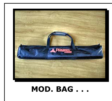
MOD. BAG . . .

Strong nylon water-resistant hand bag for Protel antennas type ARL , ARY , AR with big pockets for accessories and manual.